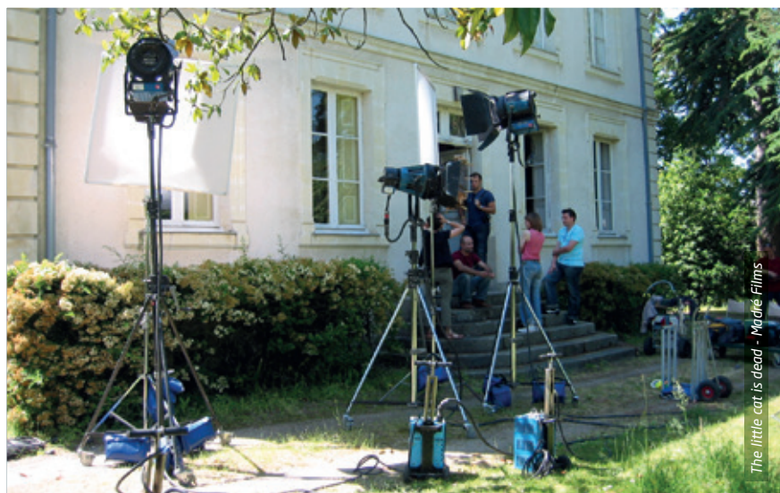
The little cat is dead - Madré Films

Dans ce guide, nous prenons spécifiquement comme référence les types de tournages des films de fictions (longs métrages, téléfilms et courts métrages) et des films publicitaires. Ces tournages sont composés habituellement d'équipes d'environ 30 à 40 personnes et peuvent se dérouler entre 1 journée et 12 semaines. Les autres types de tournages (les films documentaires, les captations de spectacles, les retransmissions et plateaux TV, les films institutionnels et les reportages) ne sont pas concernés par tous les points abordés dans ce guide, il conviendra de s'adapter au cas par cas.